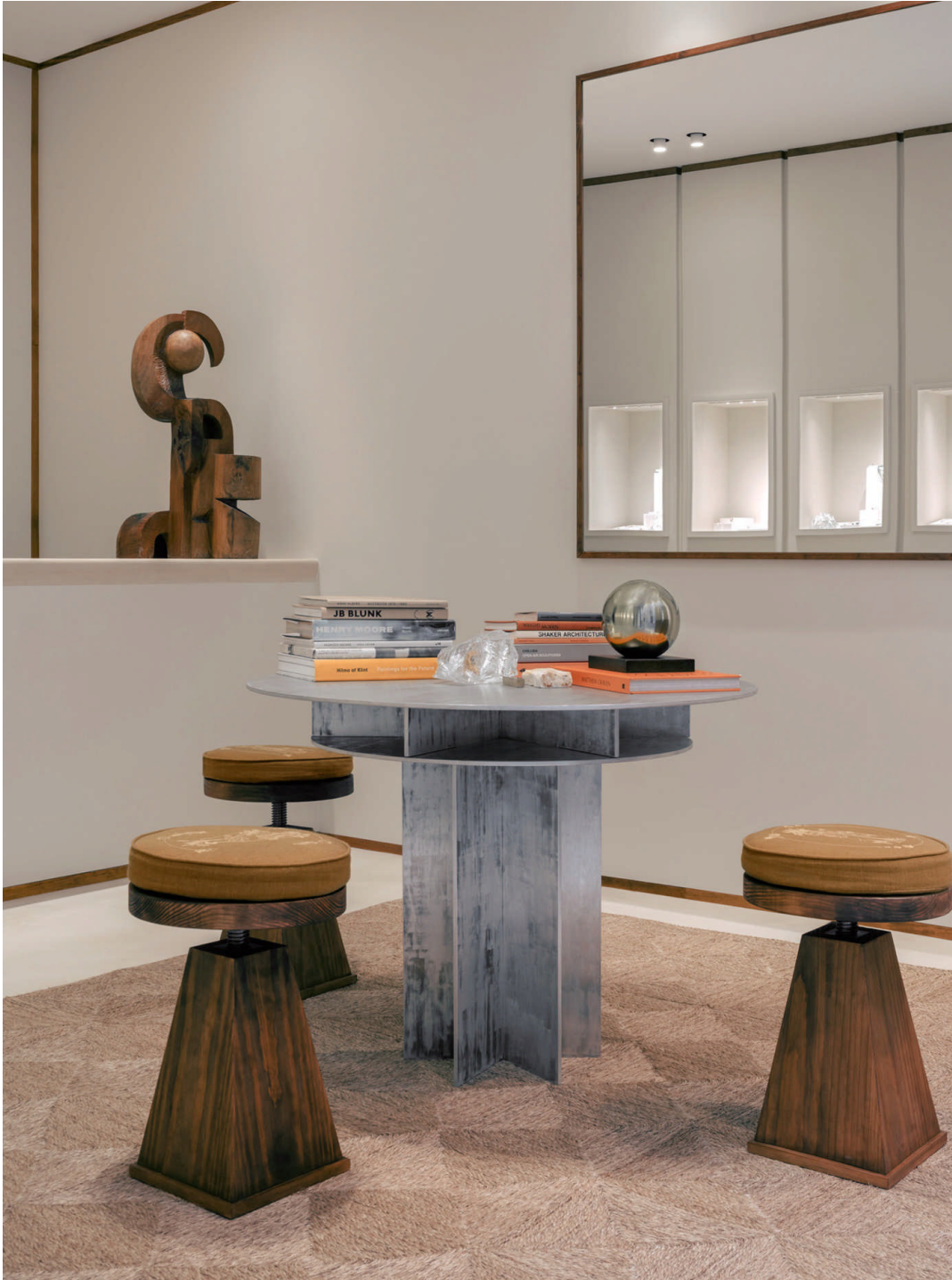
La boutique Pascale Monvoisin à Paris. The Pascale Monvoisin boutique in Paris.